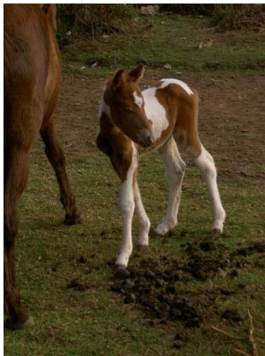
Ooty India 2009

Om du/ni sponsrar med en ponny till centret får ni bestämma namn till ponnyen.